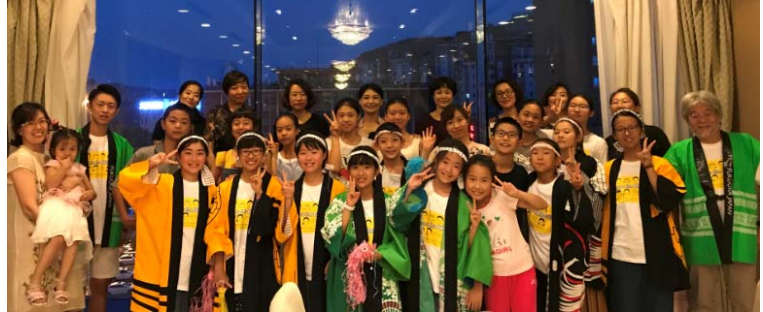
2018年8月大連派遣団 大連ホストフレンドと一緒に！

福岡・大連未来委員会は、アジア太平洋子ども会議・イン福岡（APCC）の後援で、4回目となる「福岡子ども大使派遣事業」を下記のとおり開催し、子ども大使を大連に派遣します。